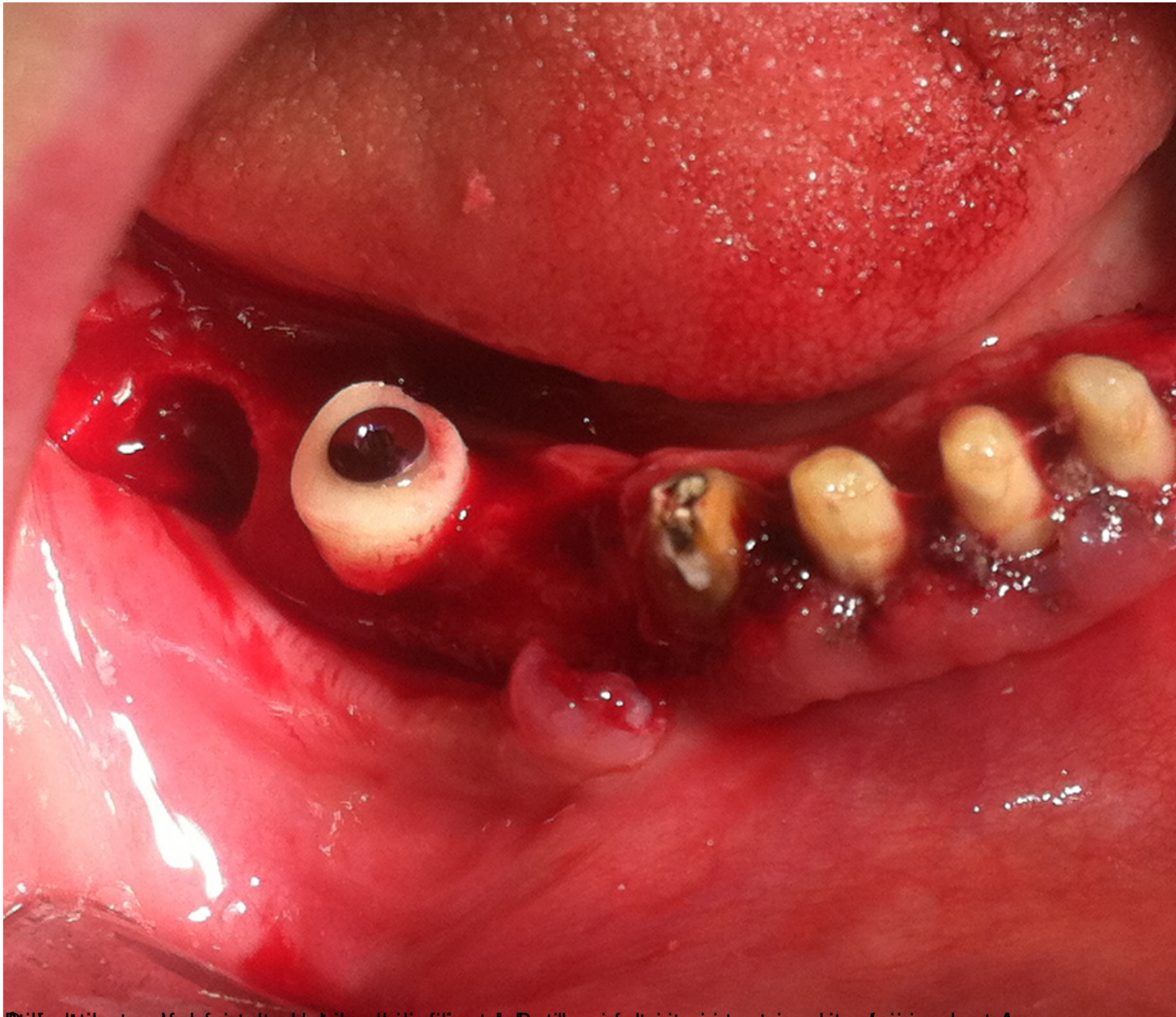
Definitive dental care for the patient, including the bone ring and teeth. The patient is shown in a supine position, and the dental procedure is being performed on the upper jaw. The bone ring is a circular structure that is used to support the teeth and provide a stable foundation for the dental work. The teeth are shown in various stages of preparation, including the placement of the bone ring and the final restoration of the teeth.